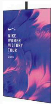
Monitor 65" con soporte de suelo o techo